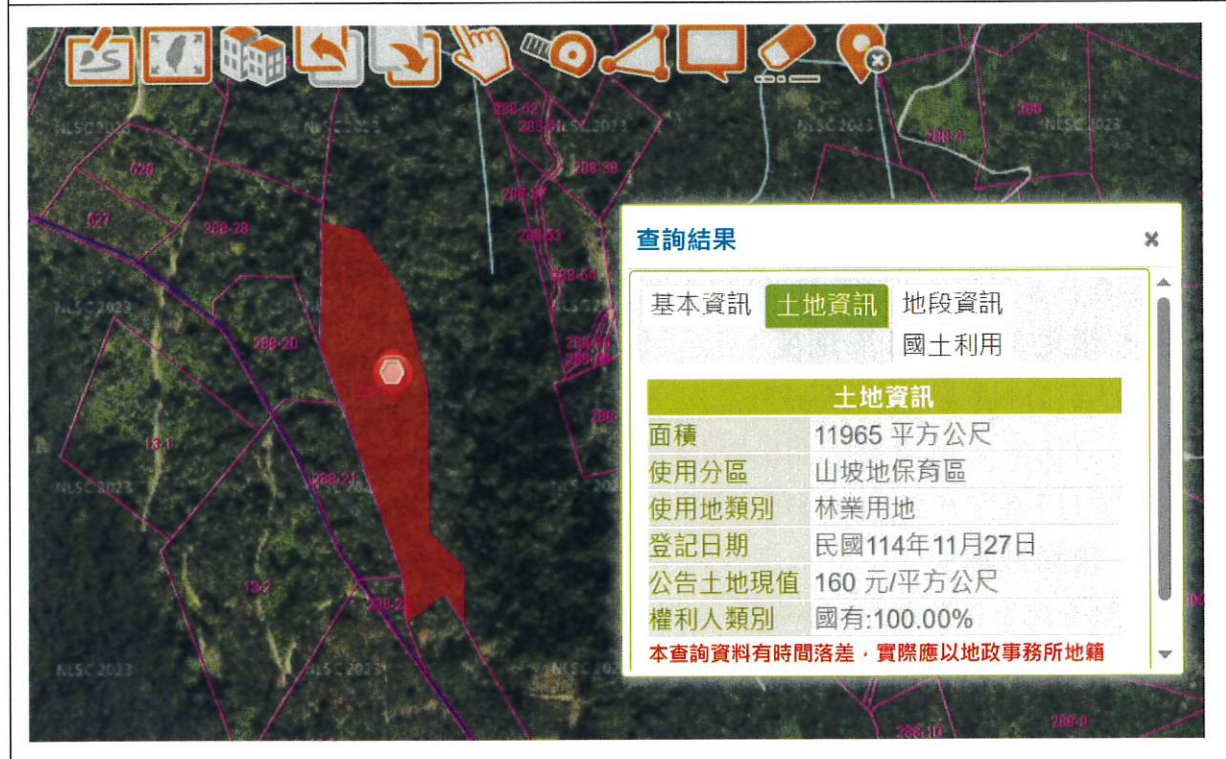
仲岳段 288-61 地號