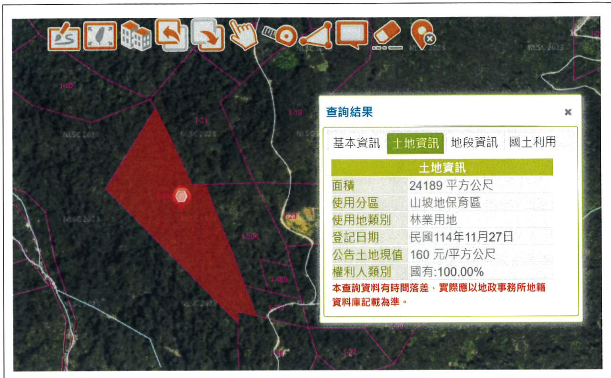
仲岳段 1-503 地號