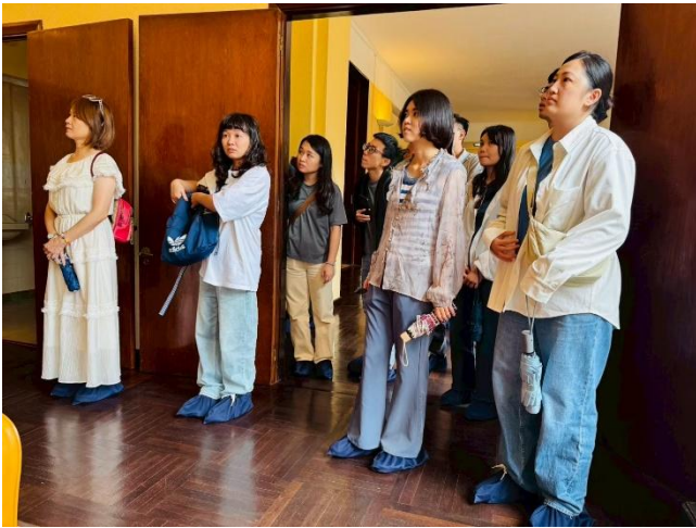
保大廈宮內部參觀

保大廈宮是越南末代皇帝的夏季行宮，也是他在大叻避暑、辦公與接待外賓的重要場所。建築保留了 20 世紀初法式優雅與東方典雅風情，是了解越南近代王室歷史的重要據點。建築採歐式現代風格，內部參觀瞭解古時保大皇、太子、皇女的生活空間，保大皇是阮朝最後一任皇帝，保大廈宮見證了越南由王朝走向共和的歷史轉折，是近代越南的象徵之一。透過提供良好的空間及環境，優質的顧客體驗，可以促進遊客的停留時間和消費意願，為觀光地帶來更多正向口碑和持續的遊客流量。