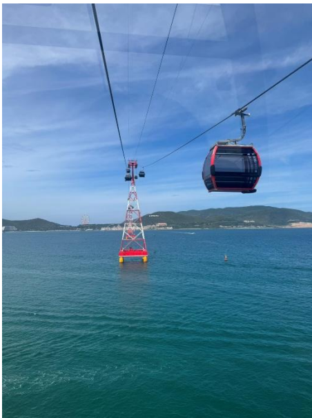
搭乘跨海纜車海景

VinWonders 主題樂園提供了豐富多樣的學習機會，從中領略到自然的美麗和生命的奧秘，也促使我們更加重視環境保護和生物多樣性。本鄉在打造觀光環境時，應重視生態永續，保護環境，讓遊客享受自然的美景與體驗的同時，也具有環保、教育、經濟促進等優點。