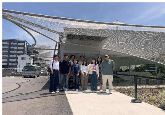
參訪團與隈研吾 Cs Somme Café 建築物外觀合影。