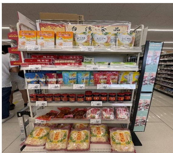
參訪 The Big 菊陽店(台積電社區超市考察)，貨架上販售台灣食品。

台積電帶動的不僅是產業發展，更促進了在地生活的多元變化。超市中台灣商品熱賣的背後，是兩地人民互相靠近的過程。在異國超市看見台灣味，不僅是一種熟悉，更是一種驕傲，見證了台灣文化在海外的影響力與溫度。