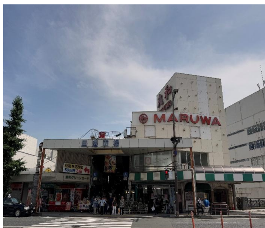
走訪旦過市場(市場案例考察)。

在市場漫步時，我們也發現了一間賣關東煮與烏龍麵的攤位。雖然空間狹小，卻乾淨整潔，牆上貼滿名人簽名，顯示其長年深受歡迎。熱騰騰的料理簡單卻充滿滋味，是體驗北九州傳統市場魅力的一環，也讓人對這座城市的日常留下深刻印象。