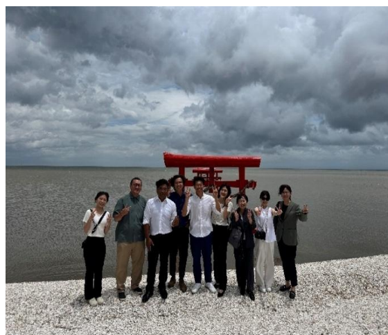
走訪佐賀縣太良町海中鳥居 (退潮) 。 走訪佐賀縣太良町海中鳥居 (漲潮) 。