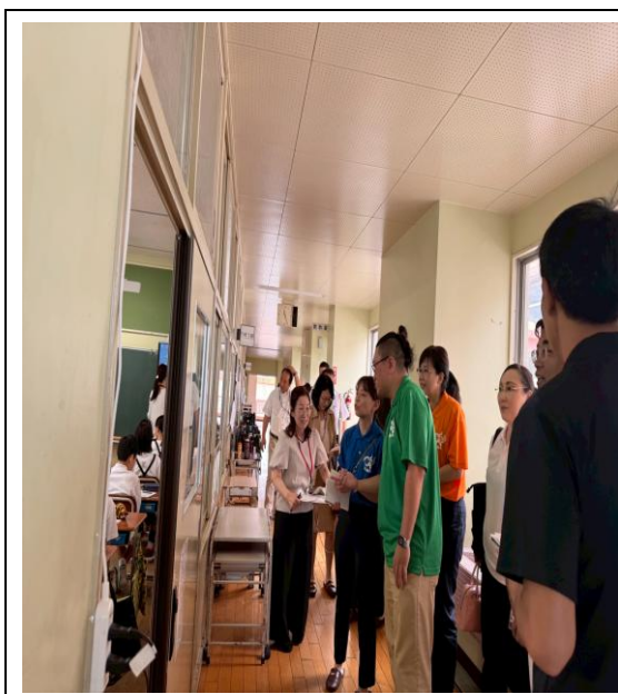
拜訪多良小學校當日為家長參訪日。

這次的參訪不只是一次教育現場的觀摩，更是一場溫暖的跨文化交流體驗。我們將這份感動與收穫帶回臺灣，也期盼未來能有更多機會，促進彼此間的理解與友誼。