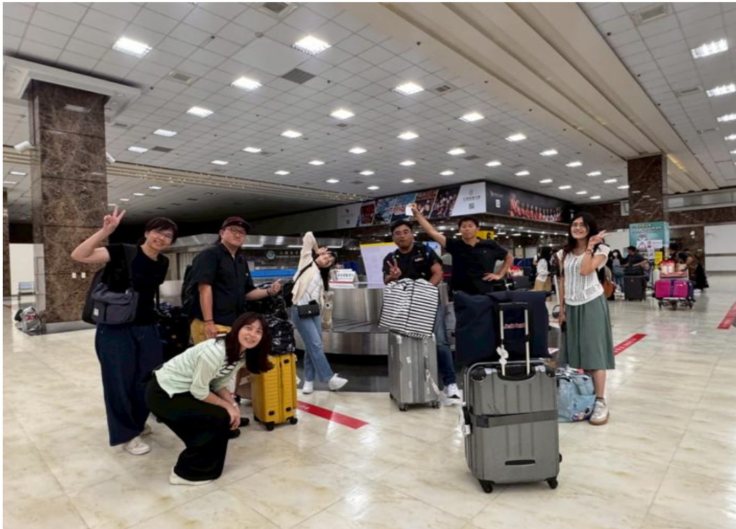
平安返台，成功完成參訪任務。