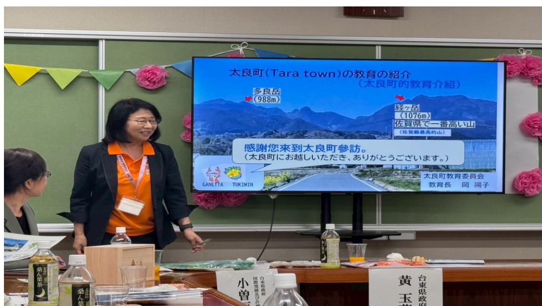
太良町教育委員會教育長介紹日本教育制度及教育方針。

這次座談不僅加深了我對日本教育的理解，也激發了對自身教育環境的省思。未來若能在本地推動類似的理念與實踐，無疑將對學生的成長與社區的連結帶來深遠的正面影響。