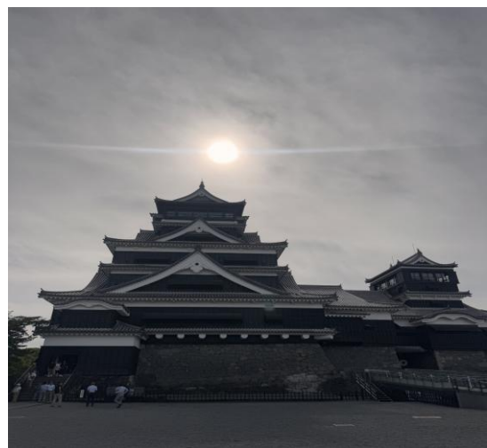
落日餘暉中的熊本城。