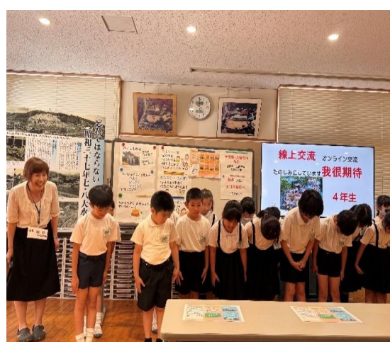
大浦小學校，由校長帶領 4 年級生歡迎參訪團來訪。