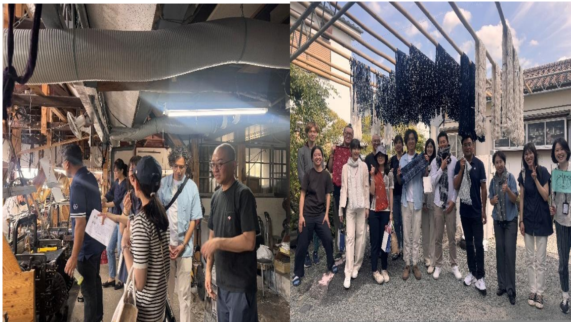
造訪下川織物紡織工廠。

本次行程中，我們參觀了工場製作現場，了解面料與圖案設計，並親手製作久留米絣圍巾，深刻體驗這珍貴的文化資產。