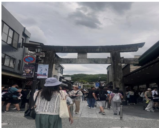
參觀太宰府天滿宮。

整體來說，太宰府天滿宮不僅是一處祈願學業的聖地，更是感受日本歷史文化與在地美食的絕佳場所，讓人收穫滿滿。