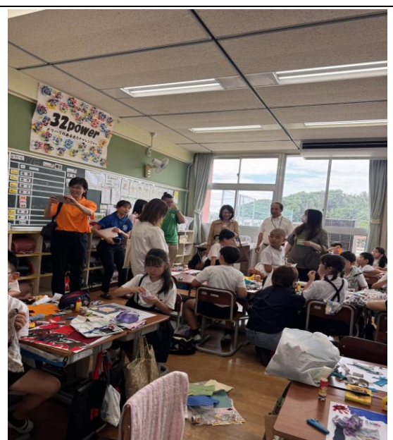
多良小學校的孩子們正在上美術課。