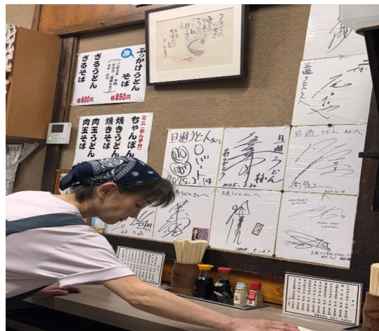
旦過市場內的攤位。