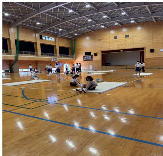
多良中學校的孩子們正在上體育課。