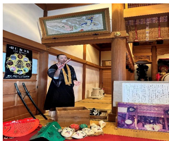
觀世音寺主持介紹國家重要無形民俗文化財產「修正會鬼祭」。