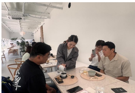
參訪隈研吾 Cs Somme Café(建築案例考察)，在咖啡館內度過一段寧靜時光。

餐點以日本茶與日式點心為主軸，融入多種在地食材，精緻如藝術品般呈現。這裡不僅是一間咖啡廳，更是一個讓人放慢腳步、品味建築與生活美學的場所。