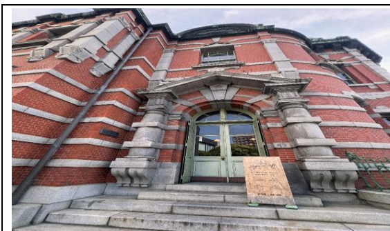
參訪 Engineer Cafe-赤煉瓦文化館(文化館活化案例考察)。

如今的赤煉瓦文化館已成為免費對外開放的文化據點，除了展覽與書籍展示，還提供會議空間，讓歷史建築持續被活用。這次參訪不僅欣賞了一座優美建築，更感受到福岡市對歷史文化保存的用心，是一次富有深度與美感的文化體驗。