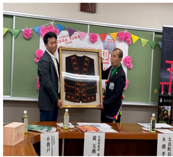
參訪團與太良町役所互贈友好禮。