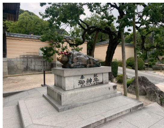
大家排隊等著摸「御神牛」長智慧。