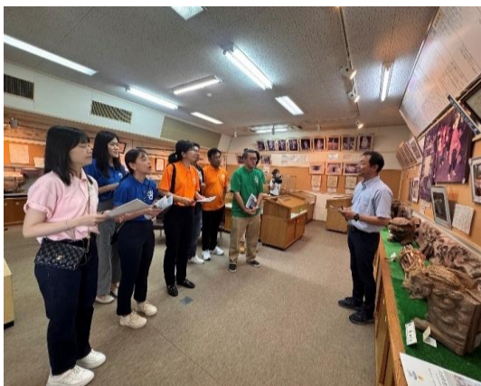
參觀太良町歷史民俗資料館。

特別的是，參觀當天，資料館課長還率領同仁戴上傳統面具，表演了一段太鼓，讓這段歷史之旅多了一份生動與臨場感。不僅學習了知識，更感受到在地人對文化傳承的熱情與用心。