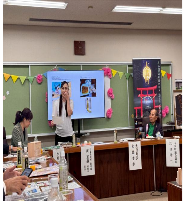
兩位交流大使分享自己的手作食品。