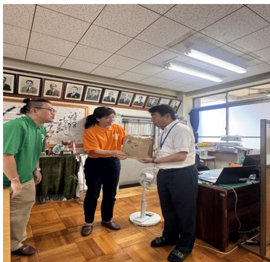
拜訪多良中學校，參觀校長室。

透過本次參觀，我們感受到學校溫暖的氛圍與師生共同努力的成果，期盼多良中學未來持續發展、再創佳績。