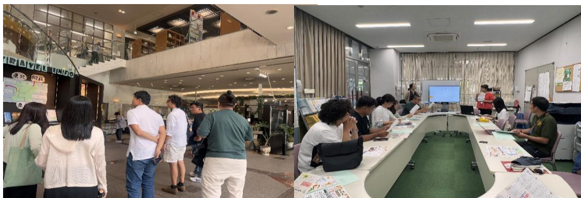
參訪熊本市外國人綜合諮詢廣場，館內提供各項免費諮詢服務。 館長簡報館內提供外國人各項諮詢服務內容與支援項目。

熊本市不僅重視行政支援，更透過日語教室、文化活動與教育資源，協助外國居民融入當地生活。由政府主導、民間協力的運作模式，使整體服務具備穩定性與延續性。未來隨著外籍人口持續成長，熊本勢必將成為日本地方城市中，多元文化共存與外國人才友善環境的典範之一。