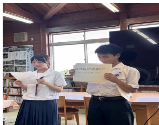
大浦中學的兩位在校學生以中文問候參訪團。