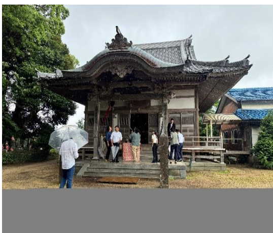
訪超過 1300 年歷史的佐賀縣縣定文化財-竹崎山觀世音寺。

此外，還有被指定為國家重要無形民俗文化遺產的傳統祭典-「修正會鬼祭」。經由住持介紹祭典的儀式內容、穿戴的服飾與佩件，不禁令人讚嘆其蘊含的民俗智慧與藝術之美。