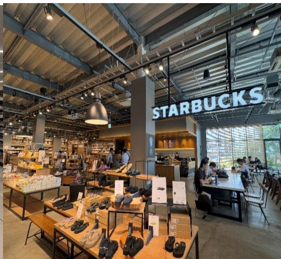
台積電於熊本設廠後，讓這股台灣味逐漸活絡了純樸的小鎮。