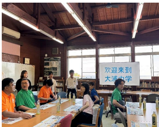
參訪大浦中學，並由兩位在校學生介紹校園日常生活。

學生會長以「勇往邁進」為全校口號，期許所有同學團結合作，持續打造更具活力與魅力的學校。是一間致力培養熱愛家鄉學生的中學校。