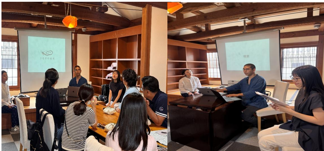
鰻魚的睡窩(白水先生演講-介紹九州文化)。

此外，八女市長年推動古民家再生運動，已修復超過百棟老宅，並活化為旅宿與文化空間，成為地方創生與觀光的亮點。這次參訪讓我們看見文化保存與現代生活的結合，也為未來台灣在地文旅發展帶來啟發。