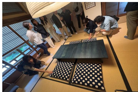
造訪 Craft Inn 手(工藝住宿案例考察)。