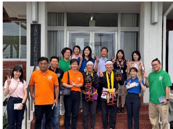
館內課長率同仁戴上面具表演太鼓。