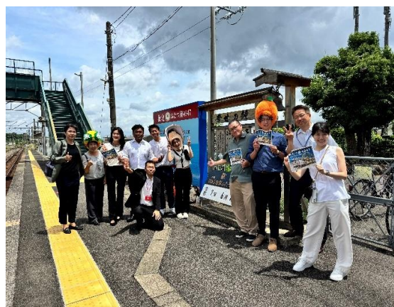
參訪團體體驗多良駅迎接搭乘 JR 九州最新觀光列車「雙星 4047 列車」的旅客。