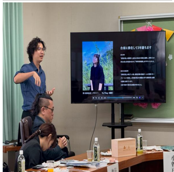
參訪團與太良町公所進行意見交流。